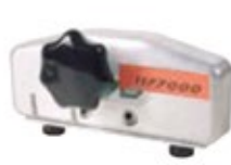
hoblik pro sražení hrany