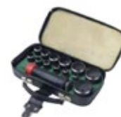
kruhový nůž na otvory