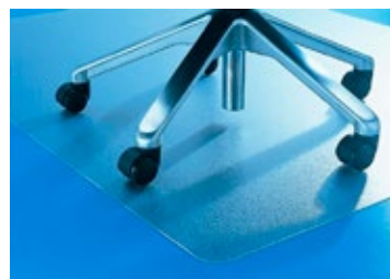
PET podložka pod kolečkové židle

* Test kolečkové židle se provádí dle ČSN EN 649, mírná změna vzhledu povrchu po testu je povolena.